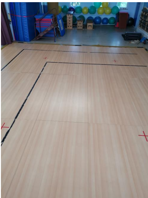
Abb. 5: Bühne