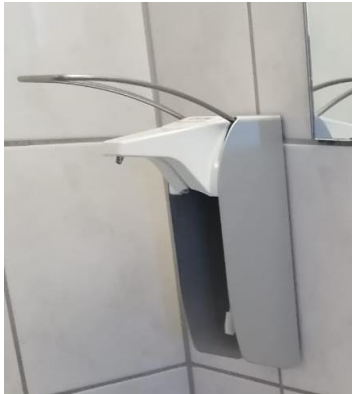
Abb. 6: Handdesinfektionsspender

Der Stoffhandtuchspender kann bedenkenlos genutzt werden, um sich die Hände abzutrocknen – dieser entspricht laut CWS boco den Hygienevorschriften des Robert Koch-Instituts.