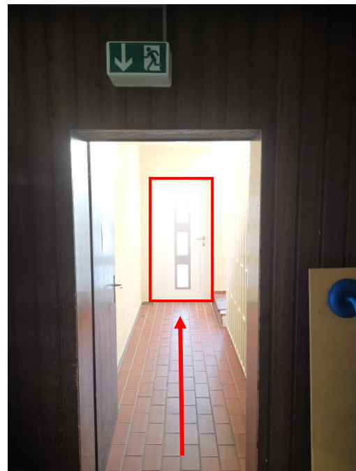
Abb. 3: Notausgang (Ans. Geräteraum 2)

In der Turnhalle dürfen sich max. 15 Personen pro Übungsstunde (inkl. Übungsleiter) - 10 in der originären Halle und 5 auf der Bühne - aufhalten; ggf. ist die Gruppenbesetzung zu rollieren, damit jedes Mitglied die Möglichkeit hat am Training teilzunehmen. Wie dies organisiert wird, ist den Übungsleitern freigestellt (Best Practice der Tischtennisabteilung: Doodle-Liste). Alternativ können Trainingsstunden auch aufgeteilt oder erweitert werden, sofern der Übungsplan dies zulässt. Dies ist vorab entsprechend mit Astrid Schmitz abzuklären.