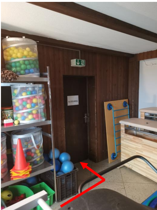
Abb. 2: Notausgang (Ans. Geräteraum 1)