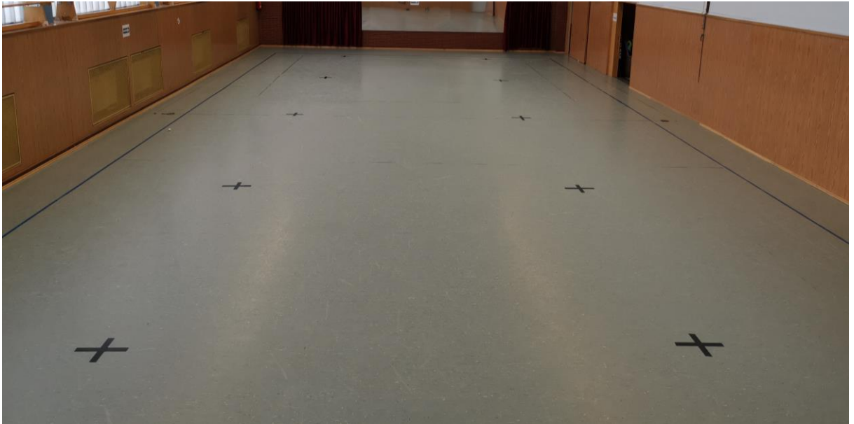
Abb. 4: Turnhalle

Um es für alle Teilnehmer und Übungsleiter einfacher zu machen die Abstandsregeln einzuhalten, wurden in der Turnhalle schwarze (s. Abb. 4) und rote Kreuze (s. Abb. 5) auf den Boden geklebt, welche jeweils die Mitte eines 20 m 2 großen Quadrates markieren.