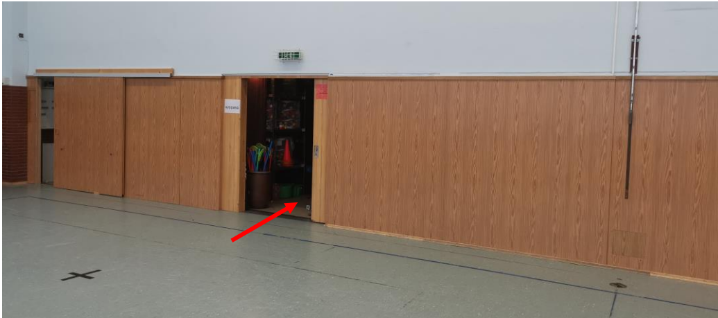
Abb. 1: Notausgang (Ansicht Halle)